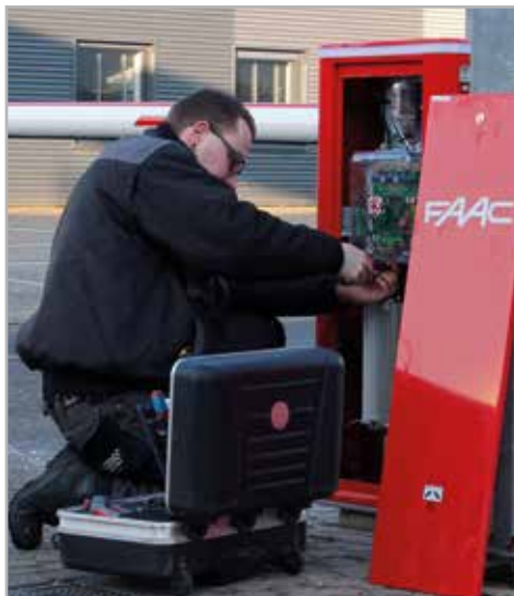
SERVICE & ONDERHOUD