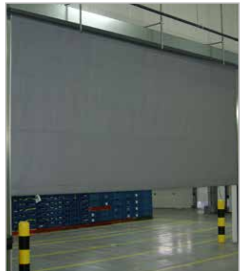
ROLLUIKEN & BRANDROLSCHERMEN