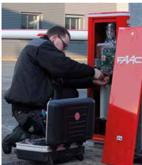
SLAGBOMEN EN BOLLARDS